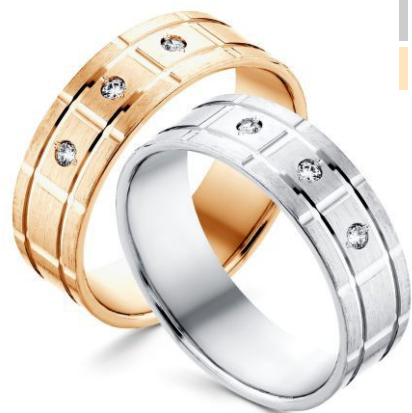
1-02-11М 1-02-11МЗ 4,10гр.