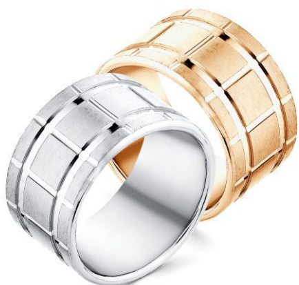
1-01-14М 1-01-14МЗ 12,20гр.