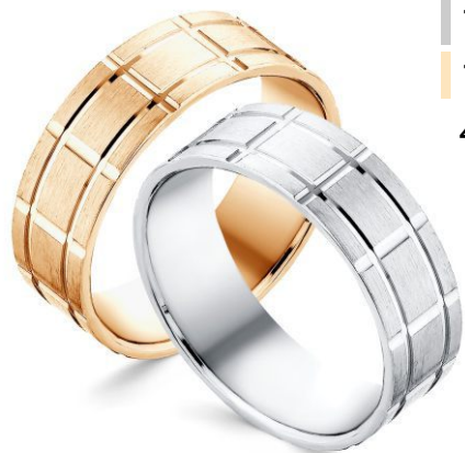
1-01-11М 1-01-11МЗ 4,10гр.